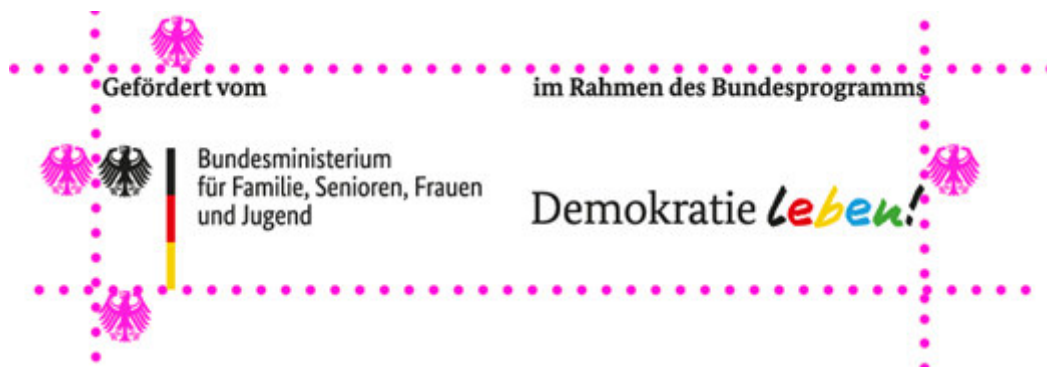
Illustration: Schutzraum um das Logo

in der kein anderes Element platziert werden darf. Die Schutzzone hat zu jeder Seite hin die Breite von einem Adlerelement.